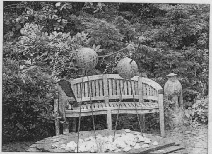
Die kessen Piepmätze entstammen dem Atelier von Marianne Dick.

ist krank auf den Tod und liegt bestattet, wo er noch zu ragen scheint. Und nicht nur der Wald: die Wildnis, die ganze Natur, gefasst in der Chiffre des Wolfes, werden vom Menschen vergewaltigt, verletzt, verstümmelt und vernichtet – so die vielleicht rationalste und dem politischen Bewusstsein nächste Interpretation der Inszenierung.